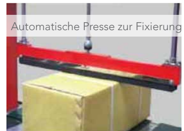
Automatische Presse zur Fixierung

Weitere Informationen unter www.kirsch-vs.de ■ Telefon: 07151 969 12-0 ■ Mail an: info@kirsch-vs.de